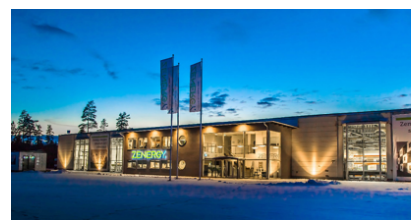
Zenergys produktionsanläggning i Skillingaryd

Zenergys moduler tillverkas på plats i den nya fabriken i Skillingaryd. Den nya fabriken ligger strategiskt belägen med expansionsmöjligheter alldeles intill E4an. Fabriken har en produktionskapacitet på cirka 1500 moduler per år. Alla produkter färdigställs och monteras på plats. Färdiga sektioner och utfackningsväggars kan levereras direkt till byggarbetsplatser.