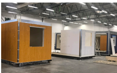
Zenergys produktion av byggbodar

Zenergy ZIP-Byggbodar är en energieffektiv lösning för arbetsbodars. Arbetsbodarna tillverkas med hjälp av en egenutvecklad teknik som medför extremt energisnål drift, exceptionell fuktsäkerhet, brandsäkerhet och formstabilitet. Kontors- och personalbodars finns i 22 olika modeller för stora och små kontor, med eller utan WC & dusch, personalbodars för 7 personer, evakueringsbodars mm.