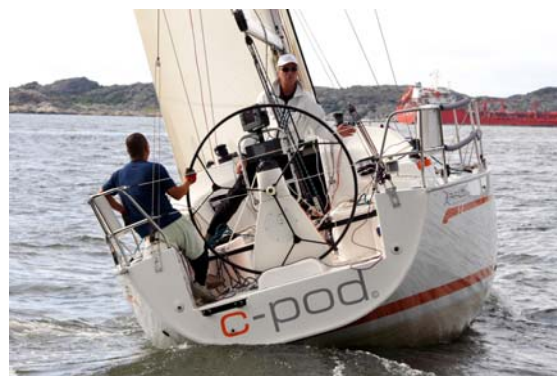
Segelbåt sponsrad av C-Pod.

Globalt beräknas antalet båtar som faller inom C-Pods marknadssegment vara ca 4,5 miljoner. Utanför Sverige har därför Bolaget samarbete med stora distributörer som tillsammans täcker 27 länder 3 . Enbart i Sverige finns det 880 000 båtar varav 180 000 faller inom marknaden för C-Pod.