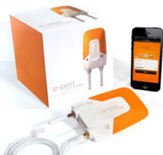
C-Pod startpaket och iPhone app.

Systemet består av tre delar, C-Pod-enheten, C Securitys servern och användargränssnittet (webbsidan, appar och SMS). All kommunikation mellan C-Pod-enheten och servern, samt mellan användaren och servern, sker via GSM-nätet. Ingen kommunikation sker direkt via C-Pod-enheten och användaren, utan all kommunikation passerar via servern. C-Pod-enheten får sin position via GPS-antennen.