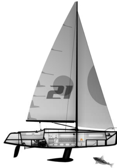
Installerad C-Pod i en segelbåt.

och hittar en GSM-operatör skickar den över all data till servern. Detta innebär att en person inte kan se var båten befinner sig när den är utanför GSM-nätet men kan se var den har befunnit sig när båten börjar närma sig fastlandet.