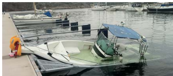
C-Pod varnar för hög vattennivå, vilket kan avvärja stora skador.