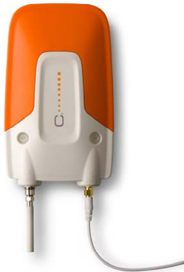
C Security Systems larmenhet, C-Pod.

Enheden har ett inbyggt SIM-kort från en av Sveriges största operatörer vilket möjliggör att enheten fungerar globalt via operatörens roamingavtal. Enheden har även ett inbyggt back-up-batteri, modem samt minne för att nämna några vitala delar.