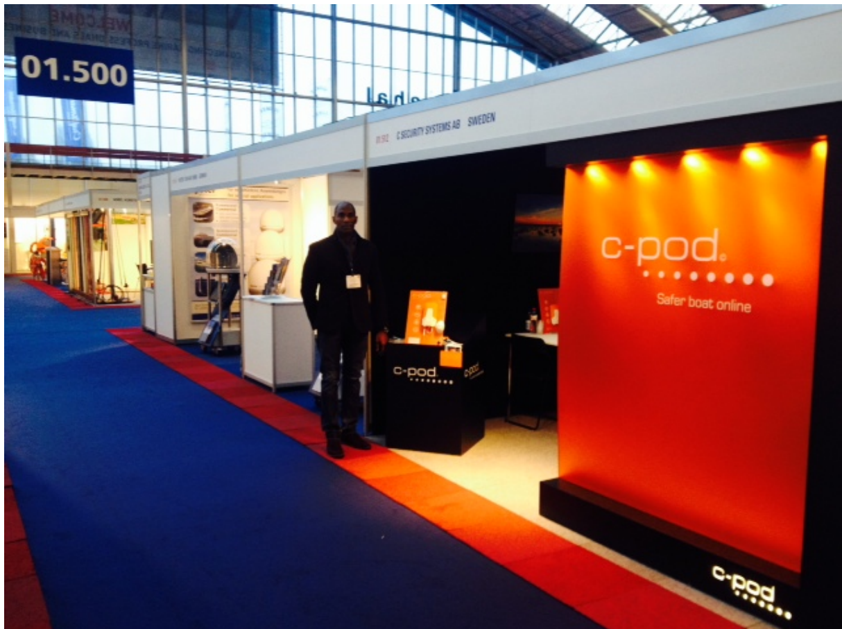
C Security Systems monter dagen innan Europas största båtutrustningsmessa, METS, öppnar 2013.