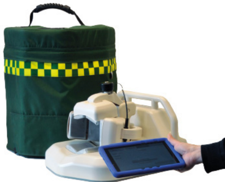
Bolagets produkt MD100 Strokefinder

Medfield har under de senaste åren stärkt sin marknadsposition inom offshore och kryssningsindustrin genom "Memorandum of Understanding" med Offshore Health Services AS och VIKAND Solution LCC. Bolagets målsättning för 2022 är att ytterligare stärka relationerna med potentiella kunder, att erhålla CE-märkning och att starta den kommersiella lanseringen av MD100. Bolaget genomför Företrädesemissionen för att i huvudsak finansiera arbetet med lansering på de första marknaderna.