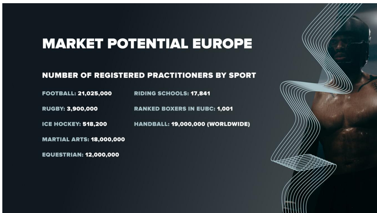
Bild D. Antalet registrerade utövare inom olika sporter.