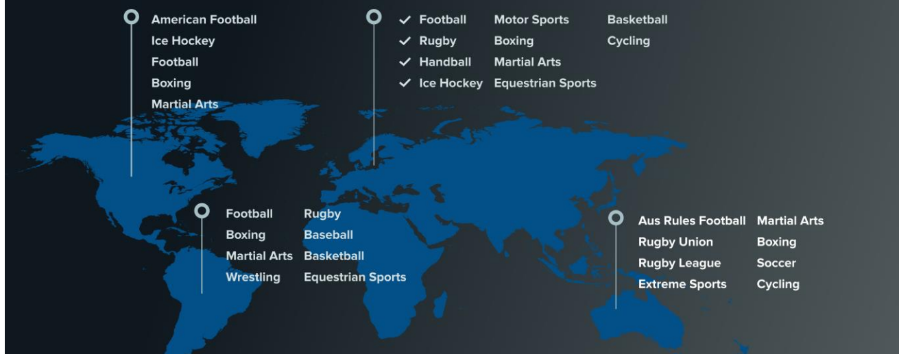
Bild B. Nuvarande och framtida marknadssegment för PolarCool och bolagets produkt PolarCap® System.