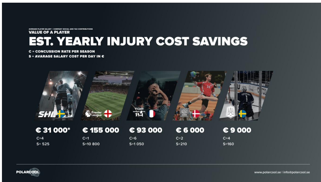
Bild E. Årlig uppskattad kostnadsbesparing för lag i olika europeiska toppligor vid behandling med PolarCap System.