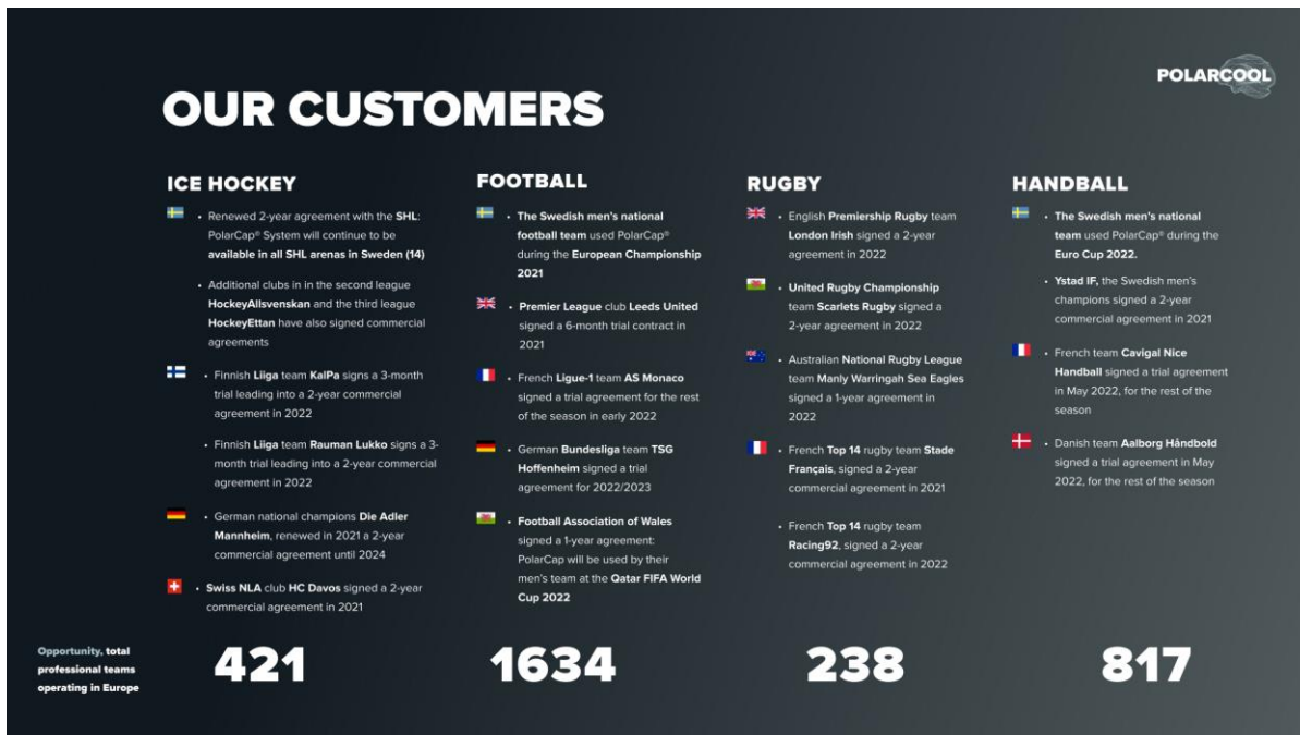
Bild C. Ett urval av de kunder som redan idag använder PolarCap System bland PolarCool's prioriterade marknadssegment. Bilden visar även på antalet potentiella kunder i Bolagets idag prioriterade segment i Europa.

Sammantaget är den europeiska marknaden mycket stor, se bild D. Inom de sporter som PolarCool fokuserar på, finns även ett betydande antal kvinnliga idrottare. Där anses behovet vara särskilt stort eftersom forskning pekar på att kvinnor är särskilt utsatta för hjärnskakning 28 .