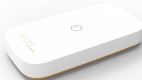
Prototyp av den nya enheten C-pod mini som utvecklas i dotterbolaget.

Efter en lyckad lansering är målet att särnotera dotterbolaget under 2019.