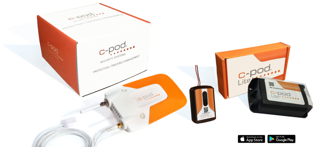
C-pod (vänster), C-pod ELite (mitten) och C-pod Lite (höger)