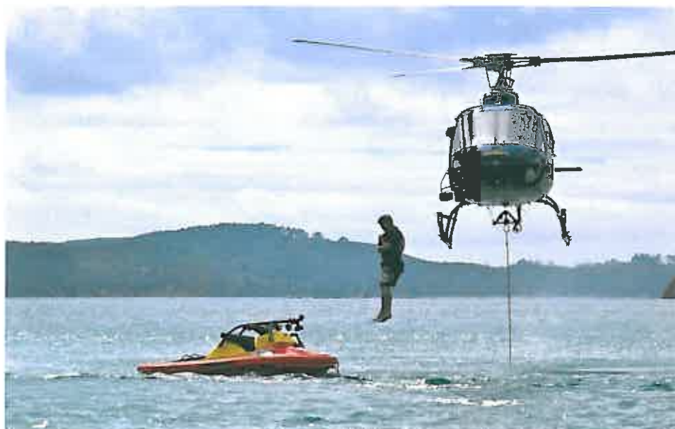
Rescuerunner sjösatt med helikopter i Nya Zeeland.