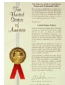
Flera av forskningsprojekten som har bedrivits inom EURIS har resulterat i godkända patent tex i USA.

European Institute of Science hade per den 31 december 2012 ingen egen patentportfölj. Nya produkter är under utveckling inom EURIS och kan komma att generera nya patentsökningar under 2013.