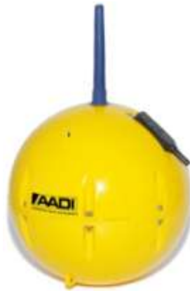
Oljespårningsboj som True Heading tagit fram tillsammans med det norska bolaget AADI

AIS är ett nytt fantastiskt hjälpmedel för yrkessjöfarten och fritidsbåtar. Sjöfartsverket kommer t.ex. att sända ut säkerhetsrelaterade meddelande via det landbaserade AIS-nätet som finns efter hela vår kust. Exempel på meddelande kan vara akuta farledshinder, navigationsvarningar, väderinformation, mm. Kustbevakningen kan också använda våra produkter för att spåra ett oljeutsläpp. Man släpper helt enkelt ner en special-AIS i vattnet och följer utsläppets utbredning och förflyttning på havet.