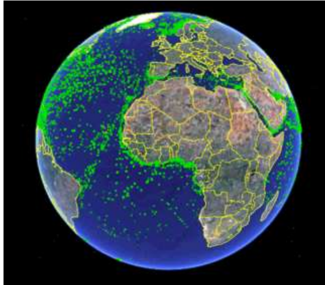
Exempel på hur fartygstrafik kan ses från rymden via AIS.

Idag placeras också AIS i bojar och fyrar efter våra kuster för att ge sjöfarten mer och bättre information om dess status. Det är t.e.x möjligt att se om bojen ligger på rätt plats och om lampan i den fungerar som den ska. Detta ökar självklart säkerheten och minskar olycksrisken. Ett ytterligare värde är att myndigheter dessutom kan använda samma system för övervakning av sin farledsutrustning. De kan därmed spara mycket pengar på underhåll av utrustning men också säkerställa hög tillgänglighet i sina farleder.