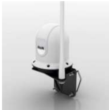
True Heading är med och bevarar arvet från Gustaf Dalén genom utveckling av framtidens farledsutmärkning. På bilden syns en AIS för farledsutmärkning som kommer att lanseras under 2012.

True Heading levererade under 2007 den första AIS-utrustningen som var unikt utvecklad för farledsutmärkning.. Den har sedan dess köpts av flera myndigheter. True Heading levererade bl.a. till Sjöfartsverket i slutet på 2009 och i början på 2011.