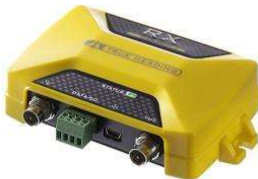
Vår AIS-mottagare AIS RX CARBON

I slutet av december 2004 fanns våra första AIS-produkter framtagna för fritidsbåtssegmentet och de kunde presenteras i samband med mässan Allt För Sjön 2005. True Headings AIS-mottagare var den första kompletta AIS-produkten som lanserades för fritidsbåtssegmentet. Den har sålts i över 5 000 exemplar i olika varianter under produktnamnet AIS RX YACHT och AIS RX LITE. Den har även sålts via andra företag under deras egna namn, bl.a. till företaget Transas.