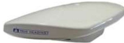
Exempel på True Headings produkter. Till vänster vår nya AIS CTRX GRAPHENE och till höger VECTOS CARBON GPS Kompass.

True Heading AB är sedan 2009 medlem i den svenska branschorganisationen Sweboat, vilket inte bara är en kvalitetsstämpel och en slags garanti för kunden, utan även en bra förutsättning för Bolaget att få hjälp med juridiska frågor avseende främst konsumentförsäljning samt en god hjälp och stöd i miljöfrågor.