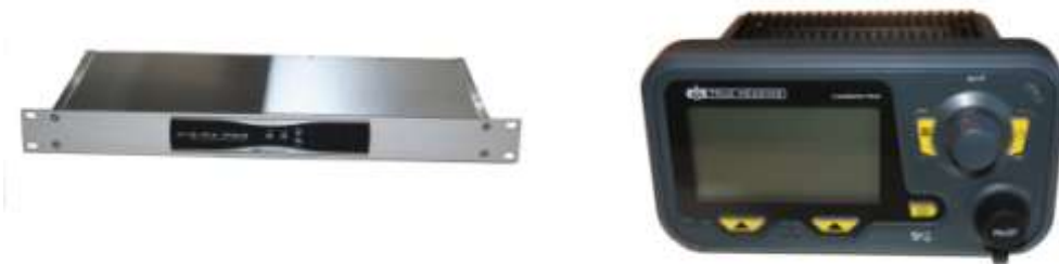
Vår mest avancerade AIS-mottagare (AIS RX PRO) och vår nya klass A transponder för den mer professionella marknaden

Till flera myndigheter levererar True Heading en avancerad mottagarlösning som används för analys av AIS-data hos sjöfartsverk och sjöförsvaret över hela världen tillsammans med en egenutvecklad specialmjukvara. Denna produkt, AIS RX PRO, har levererats till t.ex. hela svenska marinens större fartyg, turkiska marinen i ett större antal, sjöfartsverken i Hong Kong, Sverige, Danmark, Irland, Skottland m.fl. länder.