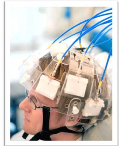
12 antenner vid mätning av frisk frivillig

Medfield Strokefinder R10 är egenutvecklad och arbetar på Microsoft plattformen Windows 7. Mjukvaran är utvecklad i samarbete med Chalmers kring algoritmer för analys samt i samarbete med Sahlgrenska Universitetssjukhus kring användargränssnitt. Integrerat i mjukvaran är stöd för dels klassificering av olika typer av patientgrupper men även stöd för monitoreringsmätning där förändring kan studeras direkt när det sker över tiden.