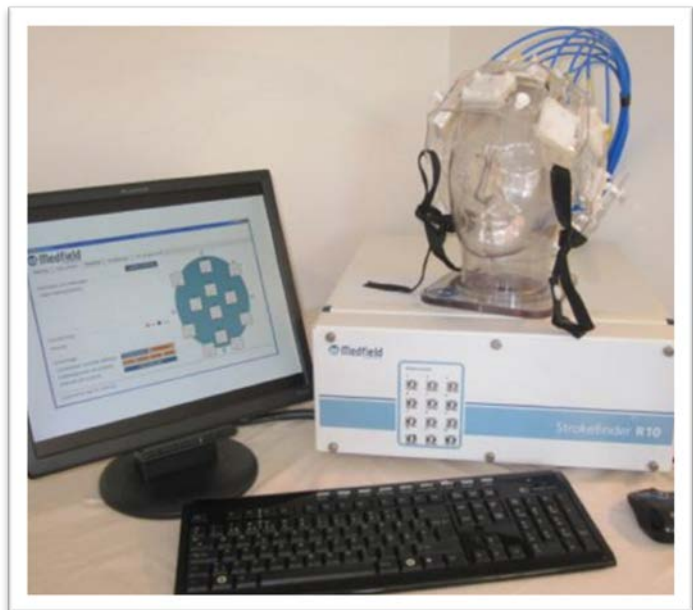
Medfield Strokefinder R10

Systemet är utformat för att kombinera maximal prestanda med maximal flexibilitet och kan ställas in både på att göra enskilda mätningar eller över tid för monitoreringsstudier.