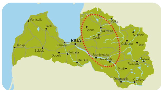
Befintligt verksamhetsområde ligger öster om huvudstaden Riga.

Fokus har tidigare legat i den norra/nordöstra regionen av Lettland – Vidzeme, Livland. Priserna på fastigheter i detta område är visserligen