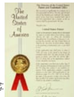
Flera av forskningsprojekten som har bedrivits inom EURIS har resulterat i godkända patent tex i USA.

European Institute of Science hade per den 31 december 2010 ingen egen patentportfölj. Nya produkter är under utveckling inom EURIS och kan komma att generera nya patentsökningar under 2011.