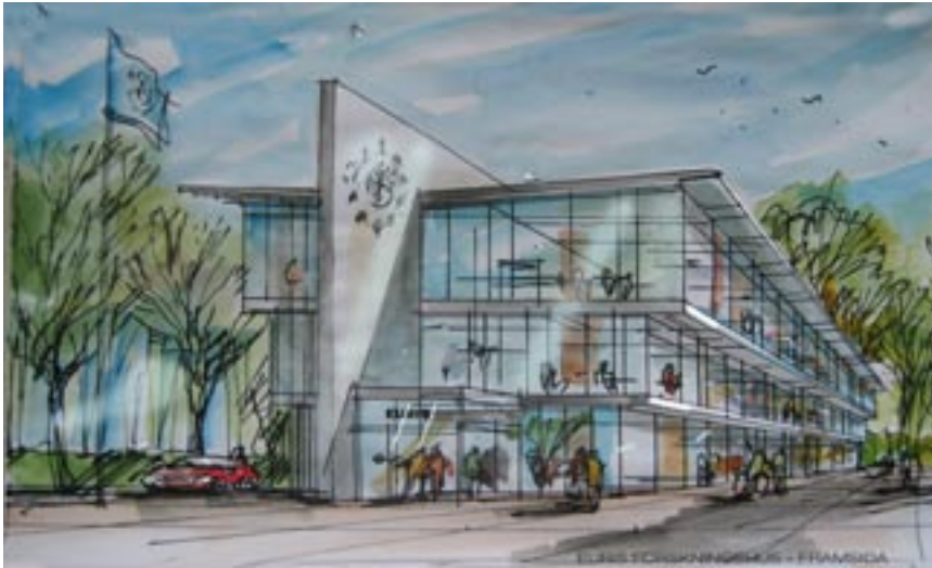
EURIS planerade forskningshus i Lund