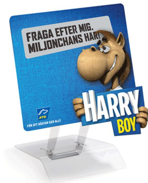
Exempel på blinkande skylt från Motion Display