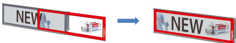
Det utbytbara färgtrycket möjliggör billiga och effektiva kampanjer