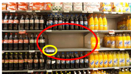
ICA-Cola slutsåld efter några timmar (röd ring) efter att Motion Displays Ink-In-Motion display(gul ring) sattes upp på hyllan.

Motion Display har idag en unik position på marknaden utan direkta konkurrenter som erbjuder blinkande displayer. Produkterna är, vad Bolaget känner till, världsunika och Bolaget har en mycket utvecklad produktionsprocess. Huvudsaklig konkurrens utgörs utav traditionell marknadsföring inom In-Store Marketing och PoP-marknadsföring (Point of Purchase) som t.ex. tryckt reklam. Positionen på marknaden har Bolaget byggt upp genom att ledning och nyckelpersoner har stor kunskap och lång erfarenhet från in-store marknadsföring inom detaljhandeln. Motion Display är ett av två företag som ingått partneravtal med E Ink inom användningsområdet. Bolaget har genom sin egenutvecklade mjukvara och elektronik skapat ett unikt produktsortiment. Det ska därför noteras att Bolaget byggt upp ett immateriellt värde i sin teknologi som utgör en hög inträdesbarriär för andra aktörer att etablera sig i samma nisch på marknaden.