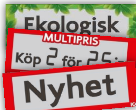
Urval av Motion Displays kundanpassade ICA-displayer