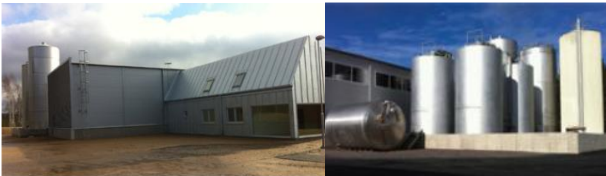
Recyctecs anläggning utanför Jönköping; kontor, reningshall och cisterner.

Så snart anläggningen är i drift kan intäkter börja genereras vid försäljning av renad glykol. Recyctec har kontrakterat en köpare. Recyctec har härutöver erhållit muntliga avsiktsförklaringar från ett antal kemiföretag avseende försäljning av kemiskt ren glykol. Dessa kemiföretag har granskat resultatet av gjorda tester som visar att Recyctecs renade glykol håller hög kvalitet. Beaktat avsiktsförklaringarna, för såväl inleverans som försäljning, reduceras risken för förseningar avseende intäkter. Styrelsens avsikt är att teckna avtal med de parter som Recyctec har avsiktsförklaringar med innan anläggningen utanför Jönköping är driftklar för att vägen till intäkter ska bli så kort som möjligt.