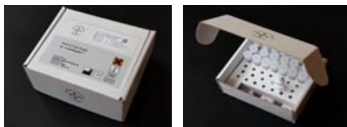
Bilden visar förpackning innehållande 20 stycken test för mätning av inflammationsproteinet C-reaktivt protein (cCRP) hos hund. Testen används med bolagets egna produkt TurboReader™.

Några övriga viktiga händelser efter balansdagen har inte inträffat.