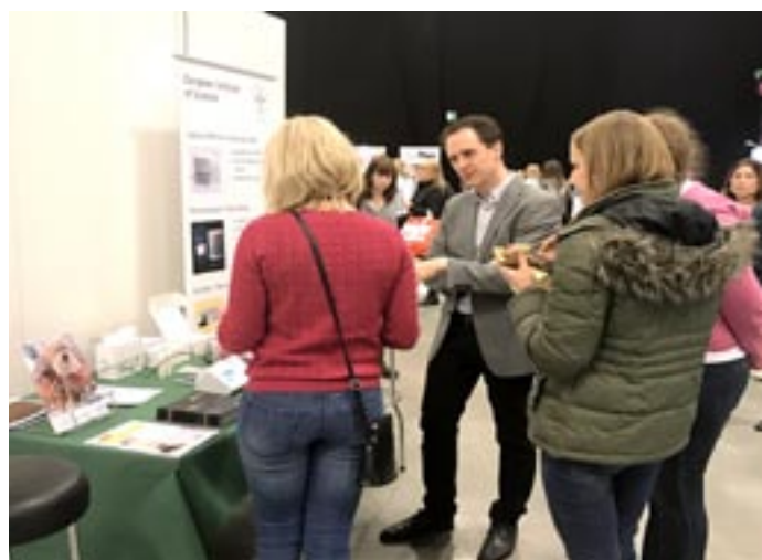
EURIS Vd demonstrerar TurboReader™ instrumentet under VeTa-dagarna i Malmö (31 mars - 2 april 2017). Responsen från slutanvändarna var mycket positiv.