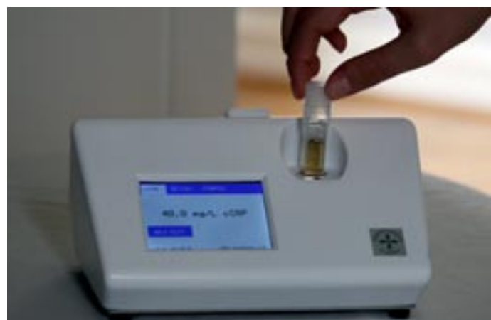
EURIS TurboReader™ veterinärt instrument för patientnära (POC) blodmätning av bl a hund-CRP.