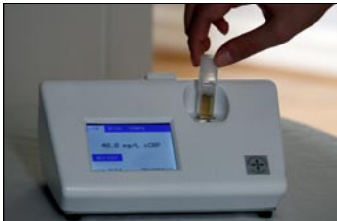
EURIS TurboReader™ veterinärt instrument för patientnära (POC) blodmätning av hund-CRP. Instrumentet erhölet EMC CE-godkännande enligt EN61326-1:2013 och EN61326-2-3:2013 vilket innebär att det uppfyller kraven på elektromagnetisk kompatibilitet (d v s att det inte kan störas av och inte blir störd av annan elektrisk utrustning) och att denna delkomponent i bolagets blodanalyssystem får säljas till kunder inom EU. Med instrumentet kan 15 stycken blodanalyser av bl a hund-CRP (inflammationsmarkör) göras per timme. Vid batteridrift kan instrumentet användas under en hel arbetsdag utan tillgång till nätspänning.

Instrumentet är kompakt för att inte ta upp onödig arbetsyta hos kunderna samt väger ca 1 kg. Det kräver inga extra kalibrerings- eller skötselprocedurer och är redan anpassat för internationellt bruk med en bred spänningsmatning (100-230 V och 50-60 Hz). Instrumentet är CE-märkt och uppfyller således EUs EMC normer. Instrumentet har en datorkommunikationsport (RS232) för utskrift av data (skrivare finns som tillval) samt för tvåvägs dataöverföring (LIS). Vidare är instrumentet anpassat för fältbruk eftersom det även är batteridrivet (5 V).