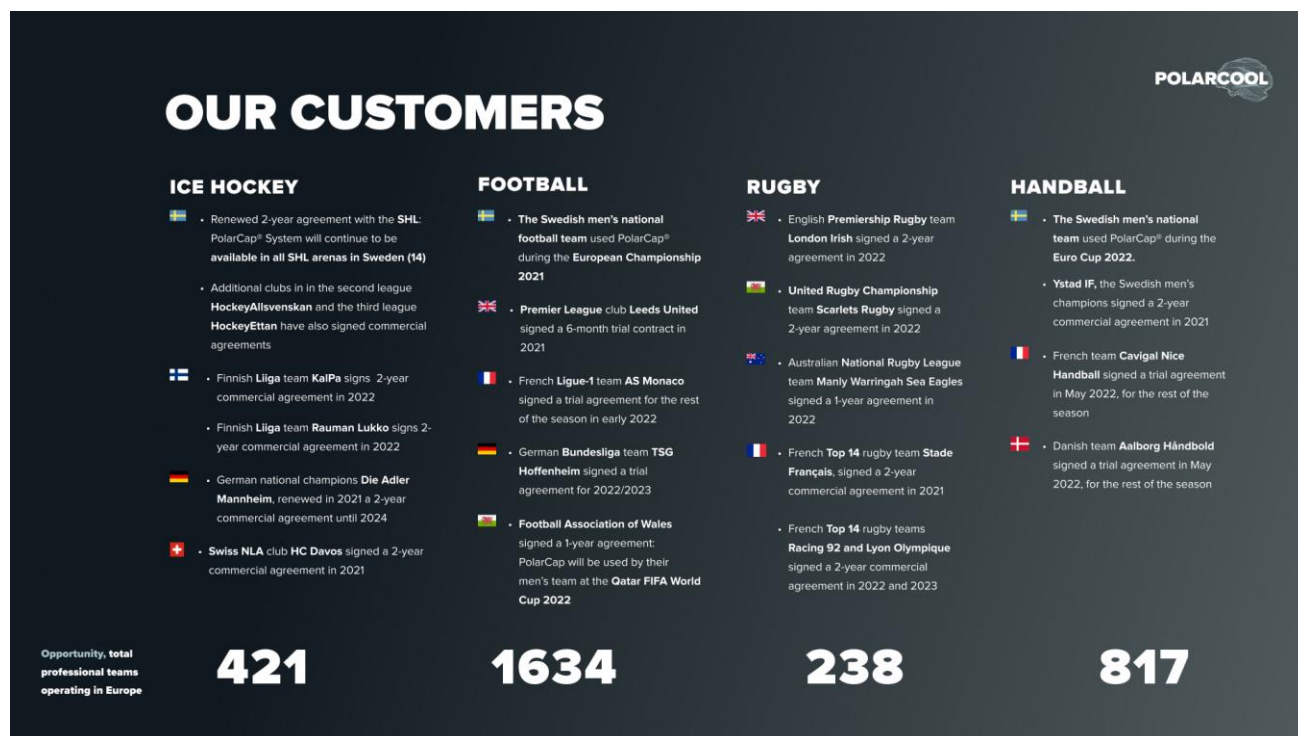
Bild E. Ett urval av de kunder som tecknat avtal för PolarCap System bland PolarCool's prioriterade marknadssegment. Bilden visar även på antalet potentiella kunder i Bolagets idag prioriterade segment i Europa.

Totalt sett finns det en mycket stor kundbas av lag i Europa inom Bolagets prioriterade kundsegment med professionella klubbar. Dessa lag ingår i ett första steg av den bredare europeiska marknadsetableringen av PolarCap® System. I handboll (817), fotboll (1634) och ishockey (421) är både dam- och herrlag inkluderade medan i rugby avser siffrorna endast herrlag. Bild E visar att det enbart inom dessa fyra sporter finns nästan 3000 potentiella kunder. Försäljningspotentialen är dock betydligt större. Ett positivt utfall av en uppföljningsstudie inom rugby kan potentiellt innebära att organisationerna kan ställa hårdare krav på att medicinsk kylning tillhandahålls vid matcher och träning även i amatörligor. Enbart på den brittiska och franska rugbymarknaden finns över 5 000 registrerade klubbar.