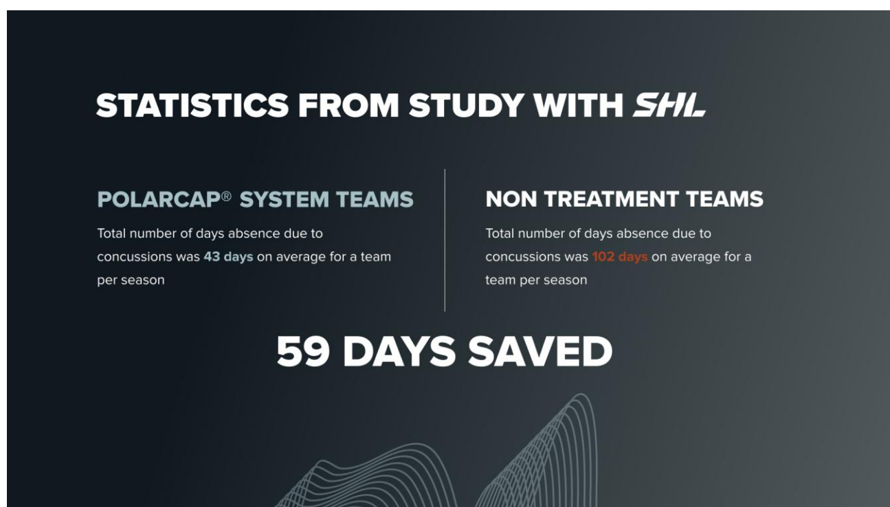
Bild B. Antalet frånvarodagar till följd av hjärnskakningar som en klubb sparar årligen genom kylbehandling med PolarCap® System.

Vid sidan av medicinsk acceptans är den ekonomiska kalkylen för klubbarna väsentlig. PolarCool kan med stöd av den publicerade studien också visa att en investering i PolarCap® System gynnar klubbar ekonomiskt. Kalkyler finns framtagna som visar på de ekonomiska besparingar som SHL-klubbar har gjort genom att tillhandahålla PolarCap® System till sina spelare under den 5-åriga studieperioden.