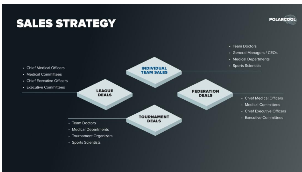
Bild A. Bolagets försäljningsmöjligheter bland kundsegment och beslutfattare.

Styrelsen bedömer att det finns flera sätt att nå slutkunden. Primärt marknadsförs PolarCap® System direkt till aktuella klubbar, organisationer och teamen bakom idrottarna. Därtill finns möjligheten att bearbeta ligor, centrala organisationer och idrottsförbund på respektive marknad. Bolaget märker också en ökad efterfrågan på turneringslösningar för landslag och federationer i samband med världs- och europamästerskap. Bolagets försäljningsstrategi sammanfattas i Bild A.