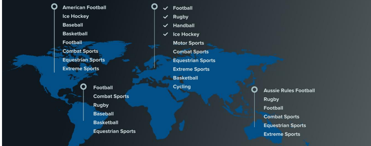
Bild C. Nuvarande och framtida marknadssegment för PolarCool och Bolagets produkt PolarCap® System.