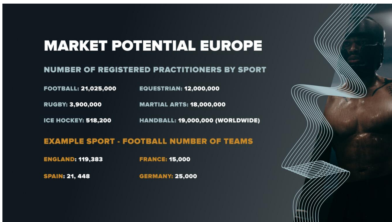
Bild F. Antalet registrerade utövare inom olika sporter.