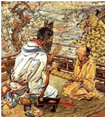
Nasal smittkoppsvaccinering i Kina för c:a 1000 år sedan